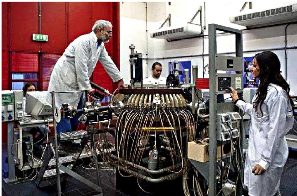
IL LABORATORIO DI FISICA DELL'UNIVERSITÀ DI MILANO-BICOCCA